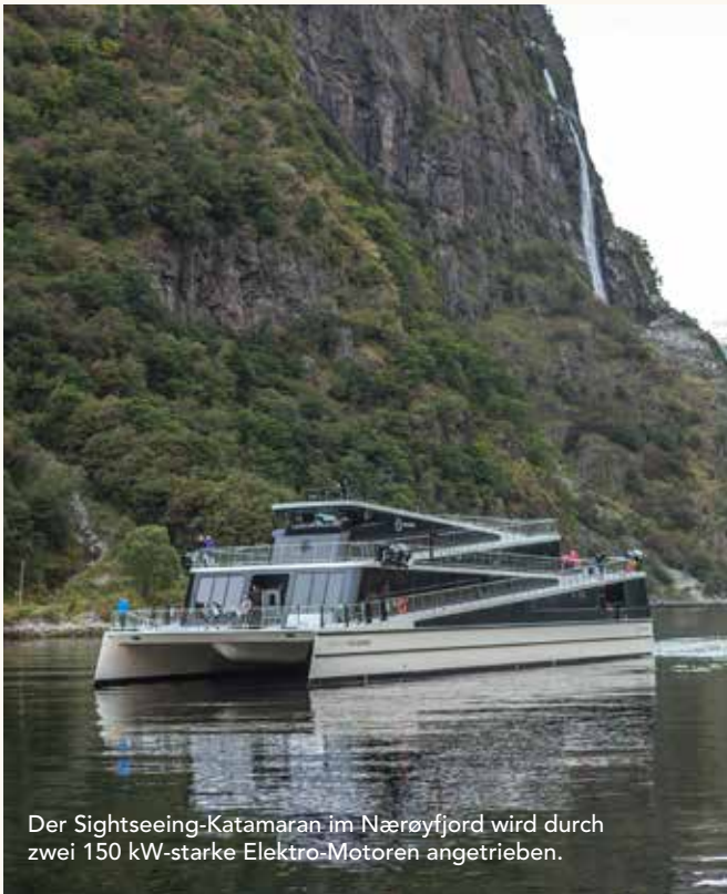
Der Sightseeing-Katamaran im Nærøfjord wird durch zwei 150 kW-starke Elektro-Motoren angetrieben.